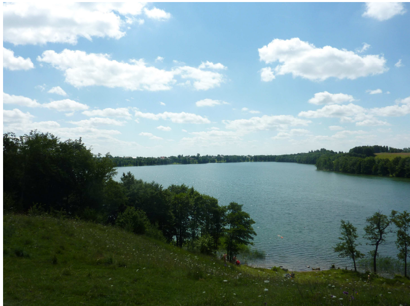
Jezioro Hancza (tiefster See Polens) im Suwalski Landschaftspark

Da es keine Berge hat, finden die Touren in der Ebene oder kleinen Hügeln statt.