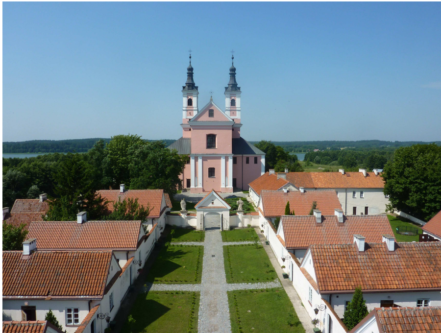
Unser Hotel in Wigry

Wir wohnen in Wigry in einem ehemaligen Kloster, heute ein gutes Hotel, und erkunden von dort aus die Region des Wigry-Nationalparks und den Landschaftspark Suwalski.